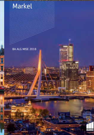
BA ALG MISE 2018