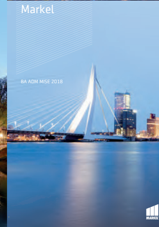
BA ADM MISE 2018