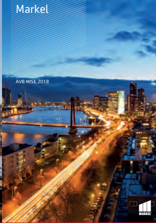
AVB MISE 2018