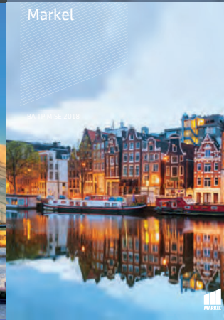
BA GZ MISE 2018