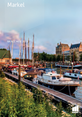
BA ACC MISE 2018