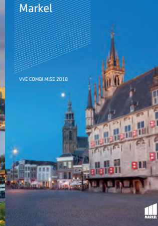
VVE COMBI MISE 2018