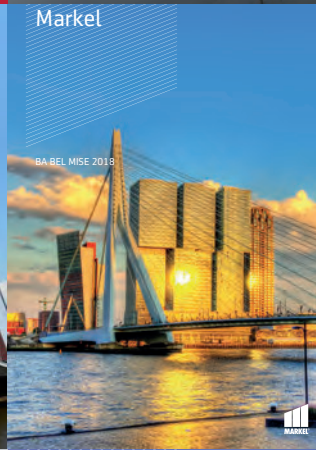
BA BEL MISE 2018