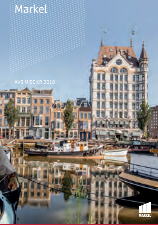
AVB MISE KR 2018