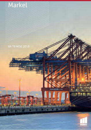
BA TB MISE 2018