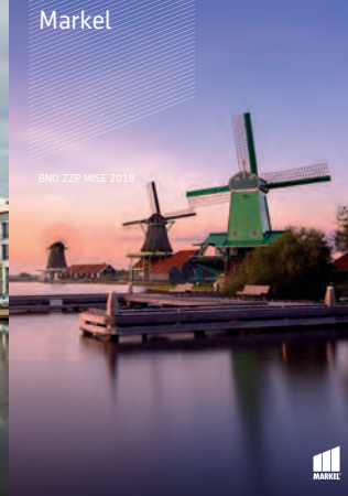
BNO ZZP MISE 2018