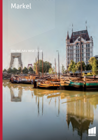
ONLINE AAV MISE 2018