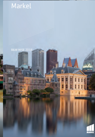
B&W MISE 2018