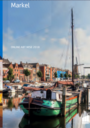
ONLINE ABT MISE 2018