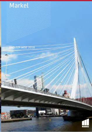
BNO ZZP MISE 2018