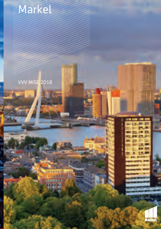
VVV MISE 2018