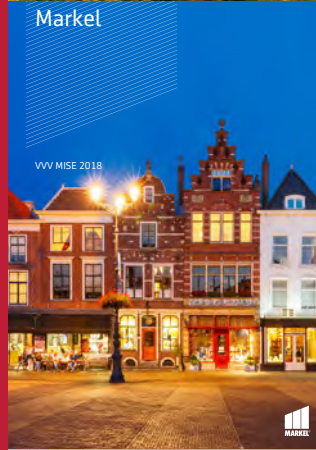
VVV MISE 2018