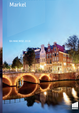
BA MAK MISE 2018