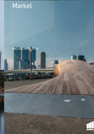
BNO ALG MISE 2018