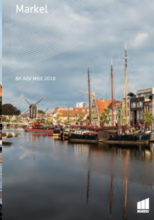
BA ADV MISE 2018