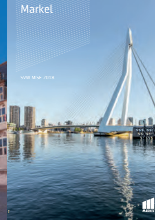
SVW MISE 2018